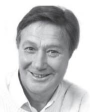
Михаил Долгинин, заслуженный артист России