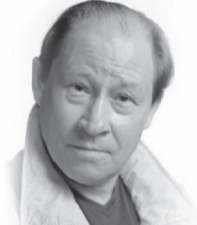
Юрий Ицков, народный артист России