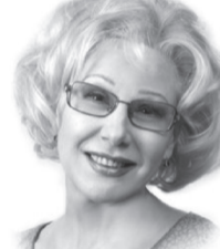
Наталья Кутасова, народная артистка России