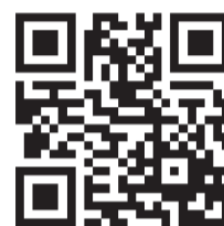
группа театра В

Государственный областной драматический театр «На Васильевском» (прежнее название - Театр Сатиры на Васильевском) - один из самых лучших театральных коллективов Санкт-Петербурга. Театр приобрел известность как в России, так и за рубежом, стал лауреатом самых престижных театральных премий страны - "Триумф", "Золотая маска", "Золотой софит". В группе театра https://vk.com/teatrnavo в социальной сети ВКонтакте рассказывают о спектаклях, проводятся конкурсы, победители которых получают два бесплатных билета на любой спектакль, а также начались публикации из цикла «Золотой фонд театра».